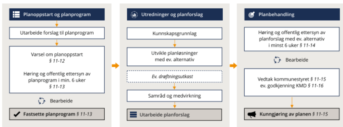
Figur 1: Proessen ved revidering av kommuneplanens arealdel

Proessen for revidering av arealdelen går føre seg som vist i figur 1: