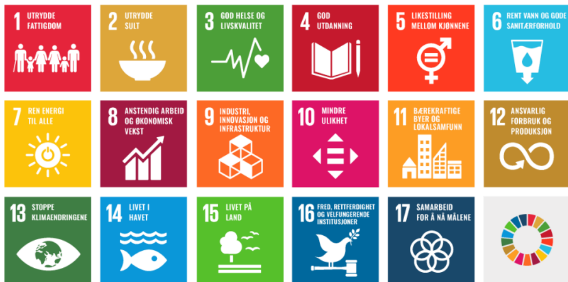
Figur 3. FNs mål for berekraftig utvikling

frå 2019 er tydelege på at FNs berekraftsmål skal leggjast til grunn for all samfunns- og arealplanlegging i Noreg. Korleis me utviklar og bruker areala i kommunen er heilt avgjerande for ei berekraftig utvikling av samfunnet.