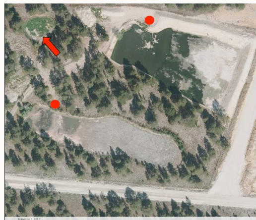
Figur 6: Bjorli renselanlegg med 2 infiltrasjonsbassenger for vekselvis drift. Det nordligste bassenget ble utvidet i 2020. Prøvetakingsbrønner er vist med røde sirkler. Grunnvannets strømningsretning er vist med rød pil.